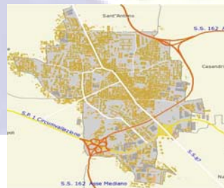
Rete idrica di Melito di Napoli Distretti