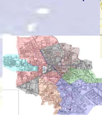
Melito di Napoli